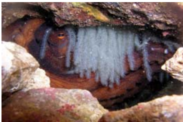
Fig. 1 Femmina di Octopus vulgaris intenta all'incubazione delle uova; Capri, -30 m.

Gli acquariologi che hanno trattato coi polpi sanno bene che questi splendidi animali hanno vita breve. La permanenza o, meglio, la visibilità nella vasca d'acquario può divenire brevissima se l'individuo immesso è una femmina fecondata -condizione che si scopre solo dopo- che, ben presto, s'infilerà in qualche anfratto della vasca, depositerà le uova e resterà lì a incubarle, senza più uscire nemmeno per alimentarsi, per diverse settimane, fino alla schiusa delle uova. Quello, però, è un momento glorioso, con migliaia e migliaia di polpetti, lunghi appena 2 mm, che, nel giro di minuti, schiudono dalle uova e si dirigono a piccoli balzi verso le fonti luminose, dando l'impressione di un continuo zampillio. I micromovimenti attivi sono compiuti a getto, con l'acqua espulsa dal mantello attraverso l'imbuto, seguiti da microspostamenti passivi verso il basso, per gravità, nei momenti d'inattività. I neonati di polpo hanno il corpo strutturato come gli adulti, seppur con proporzioni diverse, avendo l'apparato brachiale molto ridotto rispetto al mantello.