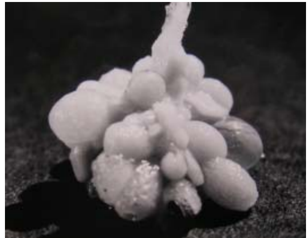
Fig. 2 Insieme degli oociti di una femmina di Sepioloidei affinis estratti dall'ovario; si apprezzano elementi di varie dimensioni, a diverso stadio di sviluppo.

La riproduzione con deposizione multipla si riflette anche nelle dimensioni eterogenee degli oociti presenti nell'ovario maturo o in avanzato stato di maturazione (Fig. 2).